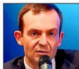
Volker Wissing (FDP): „Politik nicht nach dem Prinzip Hoffnung machen.“